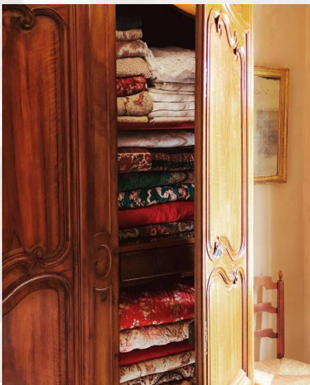
Détail du diorama de la chambre provençale, armoire de mariage en noyer (Provence, milieu du XVIIIe s.), garnie de courtépointes en coton piqué (première moitié du XIXe s.), collections du Musée Provençal, Marseille

Après une introduction générale dédiée à la vie et à l'œuvre de Frédéric Mistral doublée de la présentation au public de souvenirs personnels apportés par sa veuve lors de l'inauguration du Musée Provençal, la visite du musée se déroule selon le parcours de visite habituel, mais enrichie de lectures et de focus sur certains aspects des collections, qu'elles relèvent de la culture matérielle ou immatérielle. Dans chaque séquence, la lecture d'un extrait des Mémoires et Récits est proposée d'abord en version originale (provençal) puis dans sa traduction en français, suivie d'une mise en perspective des morceaux choisis avec les œuvres présentées, les dioramas ou certains objets qui entrent en correspondance avec le récit et exceptionnellement sortis des réserves.