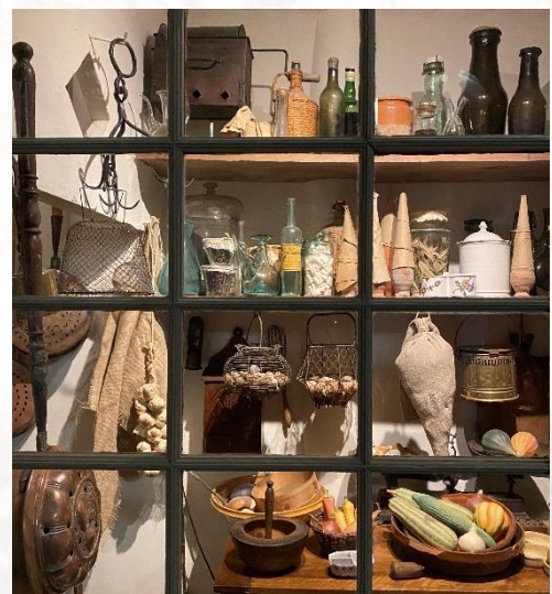
Détail du diorama de la cuisine provençale, étagères de l'estramàgi, (garde-manger), collections du Musée Provençal, Marseille

Au musée : Une présentation des œuvres et autographes de Frédéric Mistral qui composent le fonds précieux de la bibliothèque du Musée Provençal vient illustrer sa production littéraire.