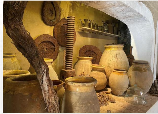
Un angle de la salle agraire où sont présentés la culture du blé, de la vigne et de l'olivier, collections du Musée Provençal, Marseille

Au musée : A travers la salle agraire, ses nombreux outils et l'ancienne aire de battage de Château-Gombert qui se trouve à l'entrée du musée, le visiteur revit, le temps d'une lecture, le temps des moissons.