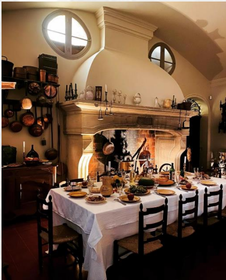
Vue générale du diorama de la cuisine provençale, avec son foyer et la table des Treize Desserts dressée, collections du Musée Provençal, Marseille